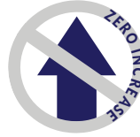
Distrito Escolar de Menasha Mill Rate Histórico y Proyectado

El Distrito podrá continuar abordando las necesidades de las instalaciones sin aumentar el mill rate por encima del nivel actual debido al pago acelerado de la deuda que el distrito adquirió en el pasado para la realización del proyecto de Fase Uno (renovación de la Escuela Preparatoria de Menasha). Este enfoque estratégico permite que el mill rate del Distrito se mantenga constante para los contribuyentes mientras aborda las necesidades de las instalaciones, mientras aborda una fase a la vez.